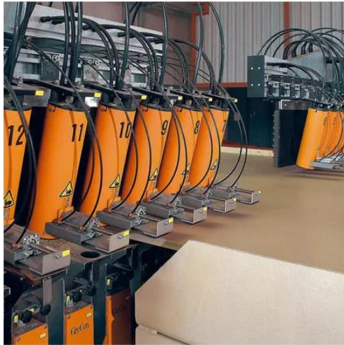
Figure 1 - Peigne ultrasons utilisés pour la détection de défauts

Le projet PanControl vise à identifier puis à fiabiliser un ou plusieurs procédés de contrôle non-destructif (CND) utilisables sur panneaux en bois en ligne de production. Ces procédés doivent permettre d'établir les propriétés élastiques et de rupture des panneaux sans avoir besoin de prélever des échantillons pour les tester mécaniquement. L'intérêt est double. D'une part, il deviendra possible de ne plus détruire une partie de chaque série lors du contrôle qualité. D'autre part, des mesures en chaîne ouvriront la possibilité d'extraire les différents niveaux de qualité des produits. Ce projet pourrait mener à moyen ou à long terme à une évolution de la réglementation si la corrélation entre méthodes destructives et méthodes non destructives est scientifiquement établie.