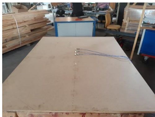
Figure 2 - Mesure de la vitesse des ondes de flexion en laboratoire

Les essais ont été réalisés avec les instruments de mesures disponibles au FCBA. Cependant des réflexions ont été menées pour pouvoir faire ces mesures avec des capteurs sans contacts bien adaptés à des chaînes de production industrielles.